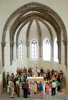
Familiengottesdienst in der Kirche St. Klara, Nürnberg