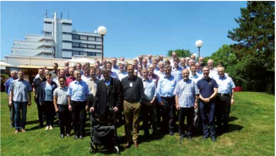
Studientag der Provinzkongregation im Heinrich Pesch Haus in Ludwigshafen