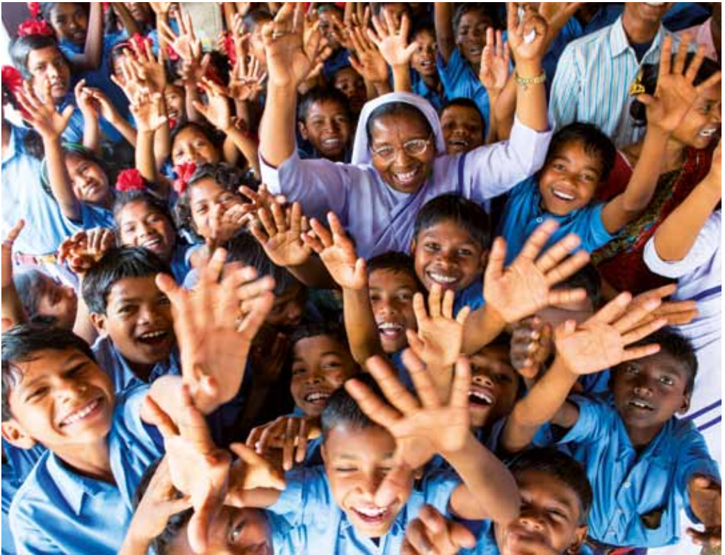
Kinder der Loyola Grundschule in Jibanpur/Sahibganj, Indien

Sohn und untereinander. Mit dieser Bitte um die Sendung des Geistes setzt die Gemeinde an dieser Stelle das Vorzeichen für die Wandlung. Die ganze Gemeinde verbindet sich mit dem Heiligen Geist. Diese Verbindung hilft mir als Priester sehr und versetzt mich nicht in eine abgehobene oder gar besonders herausragende Stellung, sondern ich bleibe Teil der Gemeinde, mit der ich dies feiere und vollziehe. Deshalb habe ich vor dieser Stelle sehr viel Respekt. Denn die ganze Gemeinde wird mit hi-