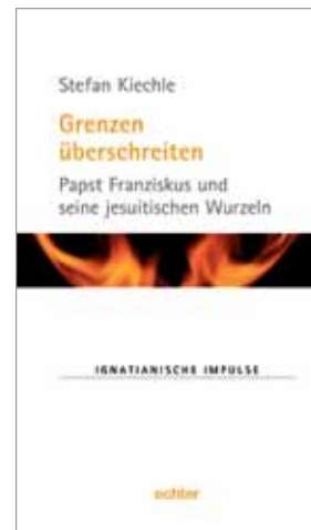
72 Seiten, € 7,90

INIGO Medien GmbH Kaulbachstraße 22a, 80539 München Tel 089 2386-2430, Fax 089 2386-2402 <jesuiten@inigomedien.org> <www.inigomedien.org>