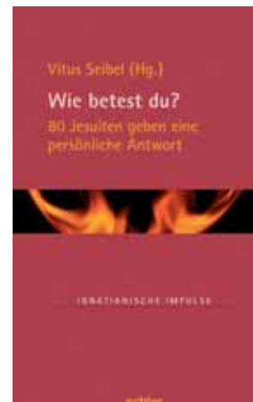
184 Seiten, € 12,90